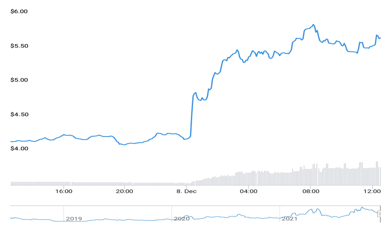
График курса Tezos к доллару США

Одна из крупнейших компаний, разрабатывающих и издающих компьютерные игры, запустила собственный маркетплейс Ubisoft Quartz. Новая платформа основана на блокчейне Tezos, курс которого после появления ранее упомянутой информации взлетел на 40%.